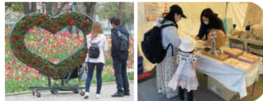
イベントではフォトスポットでの記念撮影やお楽しみ抽選会などが楽しめます