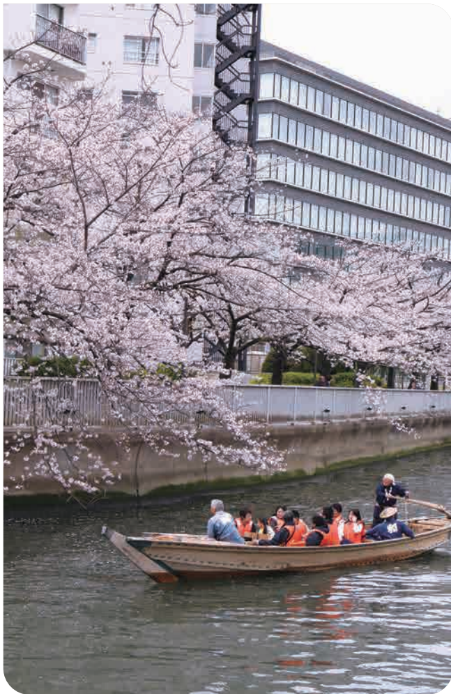
和船乗船体験は、3月20日～4月11日の土・日曜、祝日のみ。 4月12日(日)の体験はありません