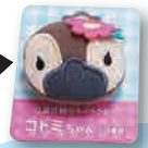
ぬいぐるみバッジ 450円