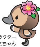
江東区観光キャラクター コトミちゃん