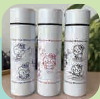
ステンレスボトルSサイズ (ブルー・ピンク・ブラック) 800円