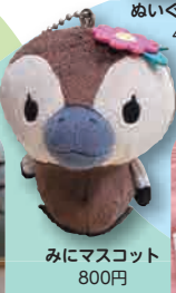
みにマスコット 800円