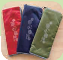
傘カバー (レッド・ネイビー・カーキ) 500円