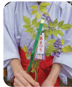
藤まつりの期間限定で授与される「藤守り」1000円