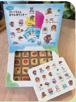
おさんぼクッキー (江東区おさんぼカード付) 800円/1箱