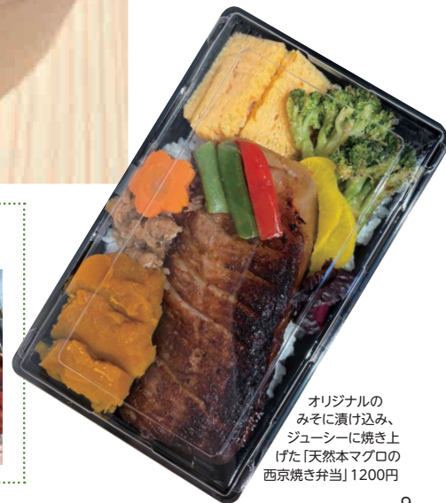
オリジナルの みそに漬け込み、 ジューシーに焼き上 げた「天然本マグロの 西京焼き弁当」1200円