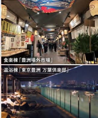
食楽棟「豊洲場外市場」