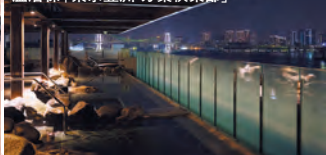
温浴棟「東京豊洲 万葉倶楽部」