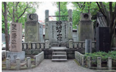
(上) 横綱力士碑 (右) 大関力士碑 両側の仙台石は明治31年に市川団十郎と尾上菊五郎が奉納