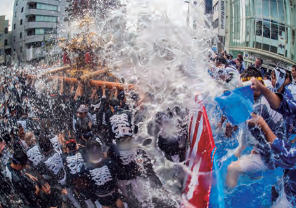
10トントラックからの水掛けは深川八幡祭り名物