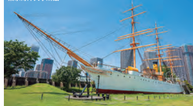
国指定重要文化財 明治丸 越中島2-1-6(東京海洋大学内) ☎03-5245-7300(代表) 「越中島駅」