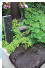
曾我五郎の足跡石