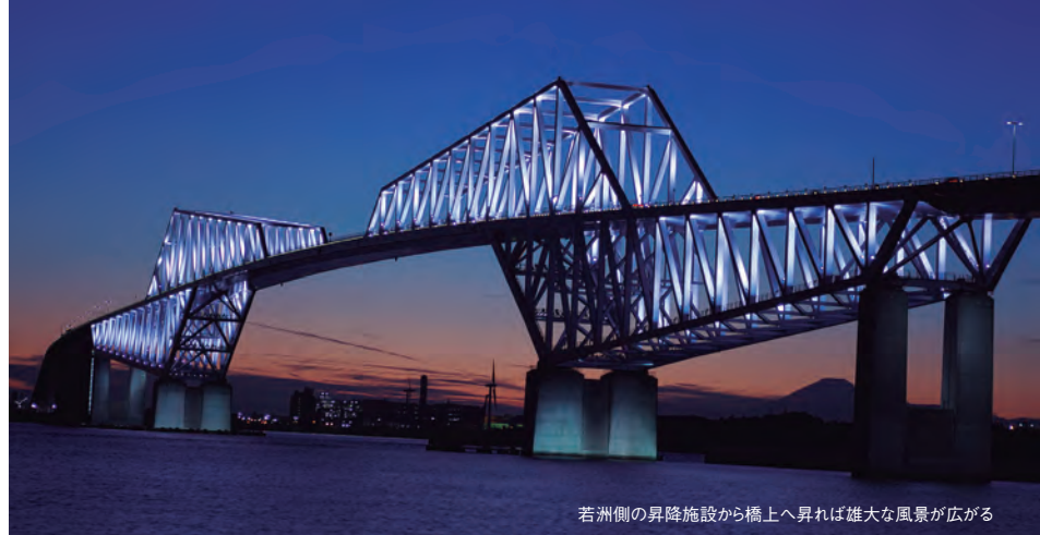
若洲側の昇降施設から橋上へ昇れば雄大な風景が広がる