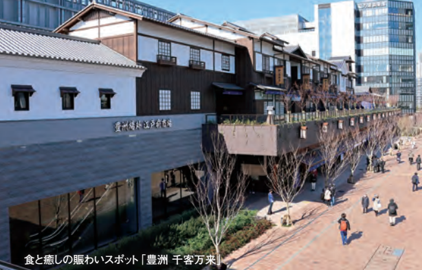
食と癒しの賑わいスポット「豊洲 千客万来」