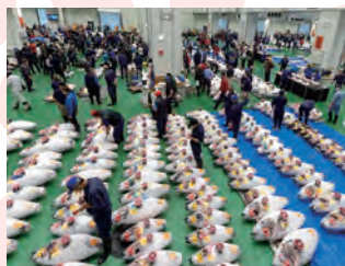
豊洲市場