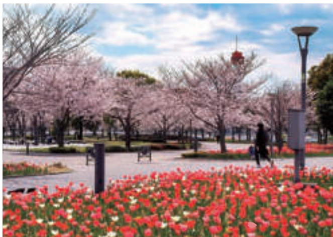
☒ りんかい線「東京テレポート」駅 徒歩2分

青海、有明、台場の各エリアにまたがり、臨海副都心内の施設をつないでいる公園。桜とチューリップが同時に咲く広場は、絶好のフォトロケーションスポット。様々な品種の桜が植えられているコーナーもあり、珍しい花木を探す楽しみも。