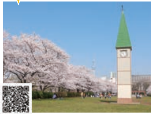
図 都営新宿線・東京メトロ半蔵門線「住吉」駅A3出口徒歩2分