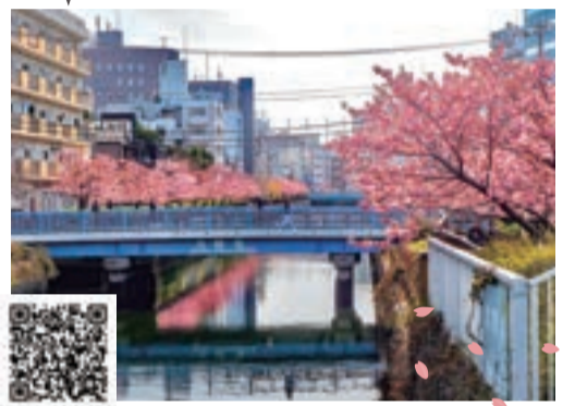
図 東京メトロ東西線「木場」駅1番出口徒歩5分