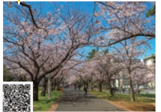
図 東京メトロ有楽町線「辰巳」駅2番出口徒歩3分