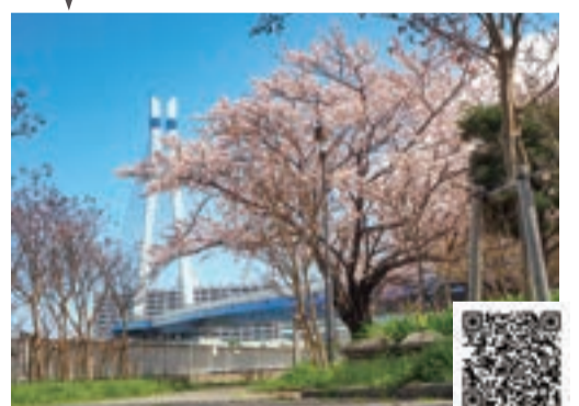
図 東京メトロ有楽町線「辰巳」駅1番出口徒歩7分